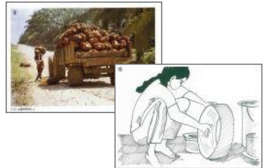
付録の写真セット（10枚）と紙芝居（10枚）