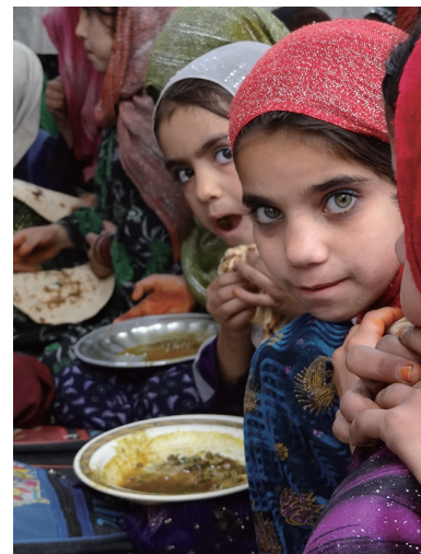
パキスタン・ラホールにあるアフガニスタン 難民小学校にて

「世界一大きな授業」の実施団体である開発教育協会と日本 Y M C A 同盟では、キャンペーン (4 月 15 日~5 月 31 日) に先駆け、キャンペーンを広める人を対象としたワークショップを開催し、「世界一大きな授業」を実施できるファミリーリーダーを育成します。