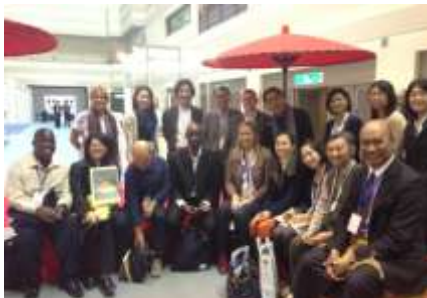
ESD ユネスコ世界会議(11 月)

2005 年から始まった国連「持続可能な開発のための教育の 10 年」の最終年を迎え、名古屋にて「ESD ユネスコ世界会議」が開催されました。